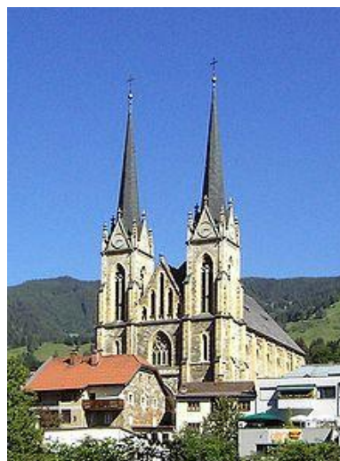
ST. JOHANN/Pongau III. subota: 16:00