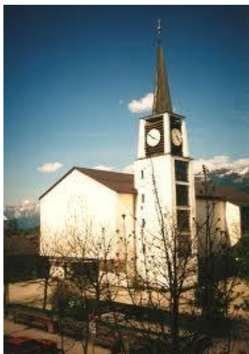
ZELL AM SEE-Schüttdorf II. i IV. subota: 16:00