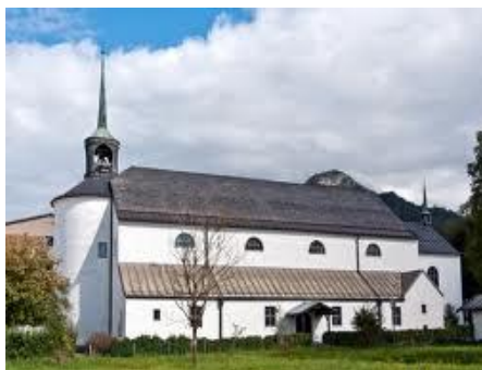
KUFSTEIN-Sparchen Nedjeljom: 12:00