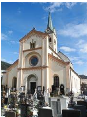
RADSTADT Nedjeljom: 15:30