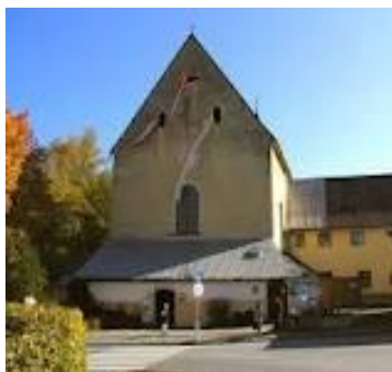
KITZBÜHEL – Kloster II. i IV. subota: 15:00