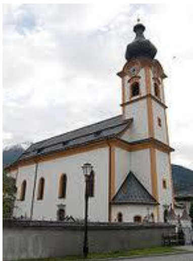
MITTERSILL I. subota: 15:00 - ljeti 16:00