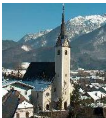
GOLLING Nedjeljom: 17:30