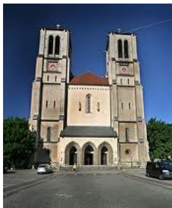
SALZBURG – St. Andrä Nedjeljom: 7:30 i 12:00